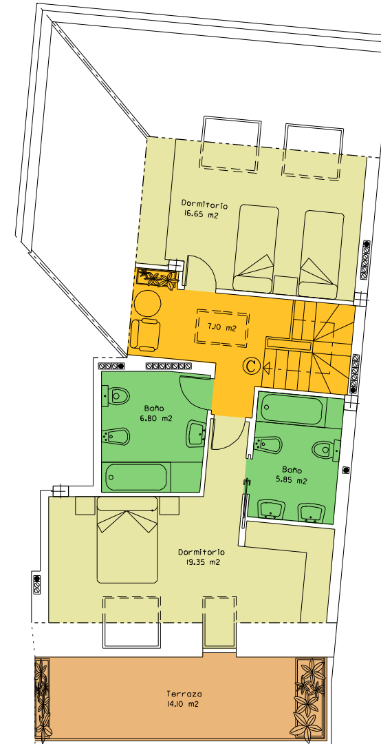
PLANTA BAJO CUBIERTA (ALTA DE DUPLEX)